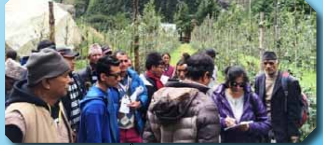
व्यवसायी अध्ययन भ्रमण, मनाङ्ग